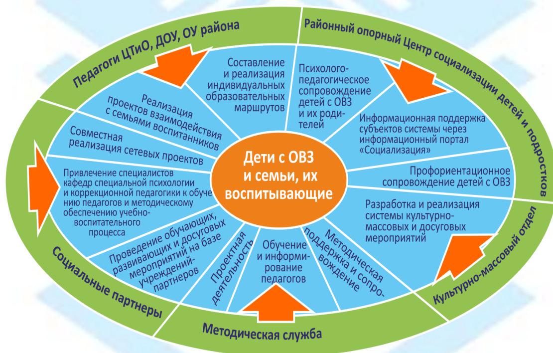
Рис.2. Система комплексной поддержки семей, воспитывающих детей с ОВЗ.