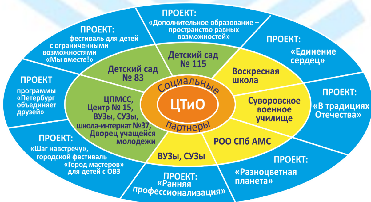
Рис.4.Комплекс мероприятий, реализуемых в рамках проектной деятельности с участием детей с ОВЗ.

Эффективность проектов «Народный календарь», «Дети – детям» и «Музыкальный диалог», реализуемых в рамках сетевой программы «Петербург объединяет друзей», обеспечивается включенностью детей с ОВЗ в совместную творческую, созидательную деятельность с учащимися коллективов ЦТиО постоянного состава: проводятся совместные детские фольклорные праздники, мастер-классы, концерты, викторины, и дети с ОВЗ принимают в их подготовке и проведении равноправное посильное участие, что обеспечивает поддержку развития детей с ОВЗ и позитивно влияет на более успешную социализацию всех категорий учащихся.